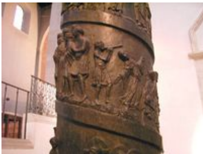
Abb. 4 Tanz der Salome

Dass die bei Mk/Mt namenlose Tochter der Herodias Salome heißt, erfährt man nur bei Josephus (Ant XVIII 136). In der Rezeption der synoptischen Erzählung findet dieser Name dann sekundär jedoch seinen festen Platz, nachgetragen aus Josephus. Der „Tanz der Salome“ wird in der Kunstgeschichte zu einem beliebten und verbreiteten Motiv.