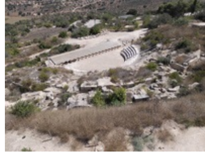
Abb. 2 Sepphoris

Wie schon sein Vater fördert auch Herodes Antipas die hellen. Stadtkultur. In Galiläa baut er Sepphoris wieder auf und gründet Tiberias; in Peräa baut er Betharamphtha aus und benennt es zu Ehren der Kaisersgattin zunächst Livias und später Julias (Bell II 168; Ant XVIII 27). Sepphoris wird ab 3 v. Chr. zur Hauptstadt der Tetrarchie. Diese Stadt (ca. 8 km von Nazaret entfernt), die im Jahr zuvor von dem syr. Legaten Quintilius Varus zerstört worden war, führt Antipas nun zu neuer Blüte. Sie enthält nun alles, was hellenistische Stadtkultur zu bieten hat. Dank ihrer günstigen Lage an der via maris erlebt sie auch einen wirtschaftlichen Aufschwung. In den Jahren 17-20 n. Chr. verlegt Antipas seine Residenz dann in das neu gegründete Tiberias. Der Ort, am SW-Ufer des Sees Genzareth und in der Nähe heißer Quellen gelegen, ist nach → Kaiser Tiberius benannt. Dass er auf einer Gräberstätte errichtet wird, trägt dem Tetrarchen jedoch die Kritik seiner gesetzestreuen Untertanen ein (Ant XVIII 36-38).