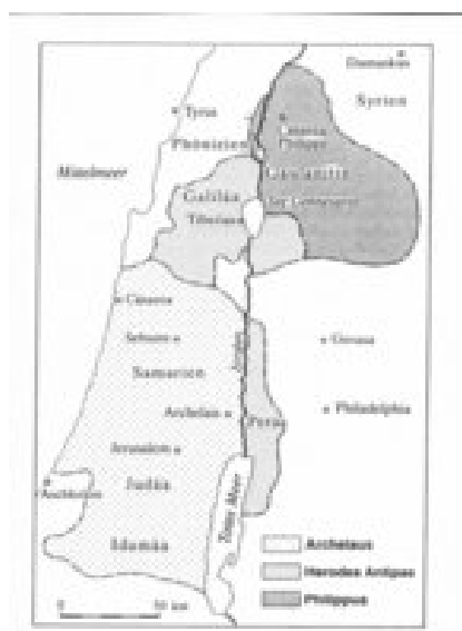
Abb. 1 Herodes des Großen Erben und ihre Territorien

In Mk 6,14.22.25.26.27 und Mt 14,9 (Hinrichtung des Täufers) wird dem Tetrarchen Herodes auch der Titel „König“ zugeschrieben, was jedoch nicht den realen Verhältnissen entspricht. Darin äußert sich lediglich die der Erzählung eigene Volksperspektive, die zudem von der Bedeutungsoffenheit des aramäisch umgangssprachlichen mlk (König / Herrscher) beeinflusst sein könnte (so Bruce, 1963, 9). Der spätere Versuch des Antipas, auf Drängen seiner Frau Herodias schließlich doch noch in Rom den Titel „Basileus / König“ zu erlangen, scheitert.