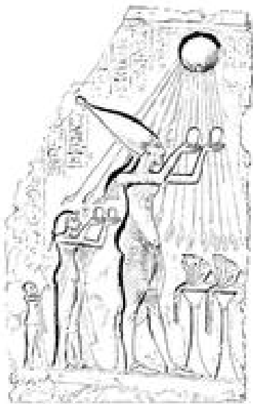
Abb. 1 Die königliche Familie beim Opfer vor Aton (Alabaster bemalt; Block Museum Kairo TN 30/10/26/12).

Bei dem Namen Aton handelt es sich um eine im Deutschen konventionalisierte Wiedergabe des ägyptischen jtn . In Keilschrifttexten des 14. Jh. v. Chr. erscheint der Name als jāti , was Rückschlüsse auf seine Aussprache im zeitgenössischen Ägyptisch zulässt. Diese vokalisierte Form findet insbesondere in neueren englischen Publikationen Verwendung, gelegentlich auch im deutschsprachigen Kontext.