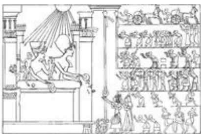
Abb. 3 Pharao Amunhotep IV. / Achenaton mit Familie unter der Sonnenscheibe vermittelt den Menschen den Segen.

Da für die Sonnenscheibe jtn während des Alten und Mittleren Reichs kein gesonderter Kult unterhalten wurde, sind aus diesen Perioden keine Heiligtümer erhalten. Die zunehmende Bedeutung der Sonnentheologie(n) macht für → Heliopolis als Zentrum des Re-Kultes ein beginnendes Kultgeschehen ab der Mitte der 18. Dynastie (ca. 1400 v. Chr.) zumindest nicht unwahrscheinlich. Ein aktiver Aufbau von Aton-Heiligtümern ist nur für die Regierungszeit Amunhoteps IV. nachweisbar. In den ersten fünf Jahren seiner Amtszeit muss eine Anlage von gigantischen Ausmaßen in unmittelbarer Nähe des Tempelkomplexes von Karnak entstanden sein. Genaue Position und Grundriss dieser Anlage haben sich bislang nicht nachweisen lassen, doch wurden Tausende Trümmer der Bauten in Tempelgebäuden der Nachfolger Amunhoteps IV. wieder verwendet gefunden.