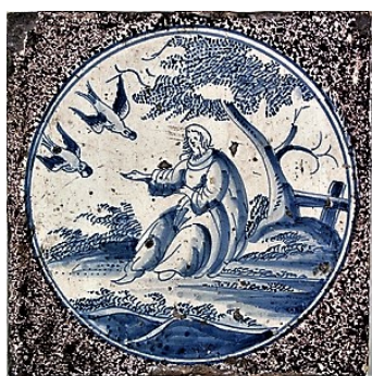
Abb. 17: Fliese aus Rotterdam um 1700).

Was das Vorkommen der einzelnen Themen betrifft, so ist die Darstellung „Elija wird von den Raben ernährt“ (1 Kön 17,6) mit 93 Bibelfliesen und 13 verschiedenen Typen der Durchführung der eindeutige „Renner“. Drei Beispiele sollen die Variationsmöglichkeiten aufzeigen.