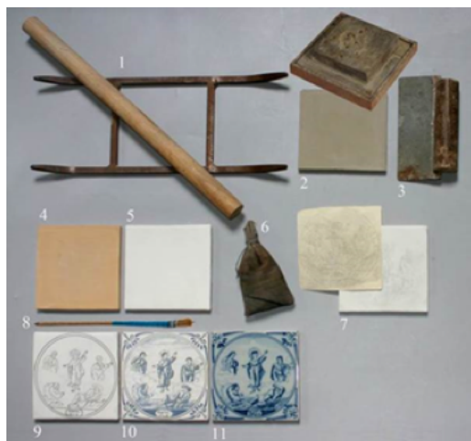
Abb. 3: Abfolge des Herstellungsprozesses.

nach innen auf Maß geschnitten (Nr. 3). Nach einigen Wochen Trocknung erfolgt ein erster Brand, der sogenannte Biscuitbrand (Nr. 4). Danach wird die Fliese mit weißbrennender Zinnglasur überzogen (Nr. 5). Sobald diese abgebrannt