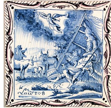
Abb. 9: Fliese mit Laubrand (N 12).

einem kleinen eigenen Feld, das oval (s. Abb. 7), trapezförmig oder rechteckig (s. Abb. 11) gerahmt ist. Die Ausführung einer Bibelfliese mit einem Bibeltext war erheblich teurer als die normale Ausführung. Mehrfarbige Ausführungen des biblischen Themas sind selten zu finden (Abb. 11).