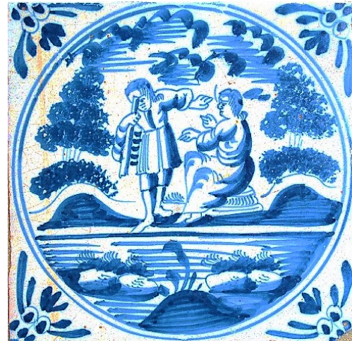
Abb. 31: „Der Splitter und der Balken“ (Mt.7,3); Harlingen 1740–1780.

(4) Die Bibelfliesen waren über einen langen Zeitraum populär. Die Blütezeit der Bibelfliesen begann ab 1640. Sie reichte bis in die zweite Hälfte des 19. Jahrhunderts. Überall dort, wo man mit dem Schiff hinfahren konnte, fanden sie ihre Verbreitung: von den Niederlanden bis Litauen, von Nordfriesland bis nach Sachsen. Selbst nach Portugal, wo es eine eigene Tradition der Azulejos gab, wurden sie exportiert.