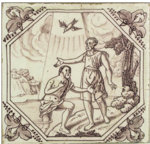
Abb. 26: „Die Taufe Jesu im Jordan“ (Mt 3,16); Rotterdam um 1760.

An zwei Beispielen wird die Konzentration auf das Wesentliche aufgezeigt: Bei der Bibelfliese „Jesus segnet die Kinder“ (Abb. 27) kann man sehen, dass in der Bildmitte die zentrale Bibelaussage zu sehen ist. Der Hintergrund ist nicht weiter ausgestaltet. Das ist bei den meisten Bibelfliesen der Fall. Dadurch wird eine Fokussierung auf die zentrale Textaussage erreicht. Diese Fokussierung ist sicher einer der Gründe, weshalb die Bibelfliesen so ansprechend sind, auch wenn bisweilen die malerische Qualität verbesserungsfähig ist. Bei der Bibelfliese „Die Taufe Jesu“ (Abb. 26) steht ebenfalls die Kernaussage im Zentrum. In der Regel werden auf einer Bibelfliese auch nicht mehr als zwei bis drei Personen dargestellt. Auch diese Darstellungsweise trägt wesentlich zur Fokussierung und Deutlichkeit der Bildaussage bei.