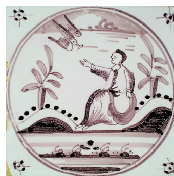
Abb. 19: Fliese aus Harlingen, um 1870.

Weitere „Renner“ sind: „Kain erschlägt Abel“ (74 Fliesen), „Isaaks Opferung“ (63), „Der Sündenfall“ (60), „Die Kundschafter im Gelobten Land“ (57).