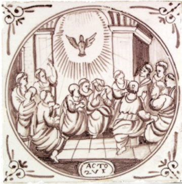
Abb. 7: Fliese mit doppelrandigem Kreis (N 215).