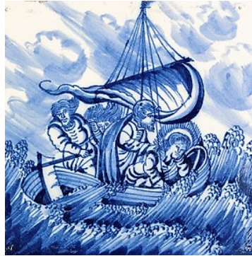
Abb. 8: Fliese ohne Bildrand (N 140).