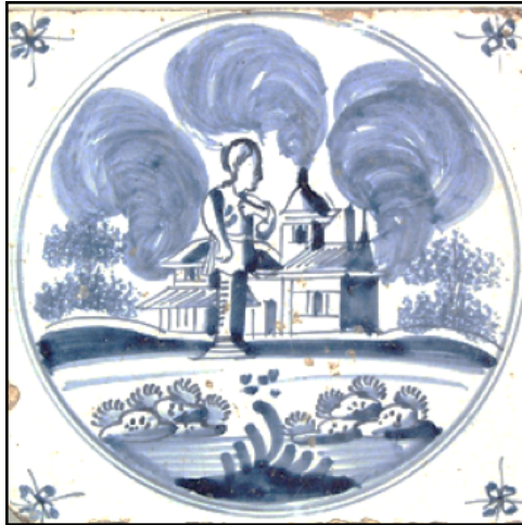
Abb. 30: „Lots Frau ist zur Salzsäule geworden“ (Gen 19,26); Makkum um 1740.