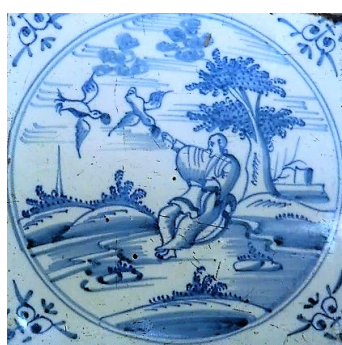
Abb. 18: Fliese im „Vielstädter Burnhus“ in Hude/D.