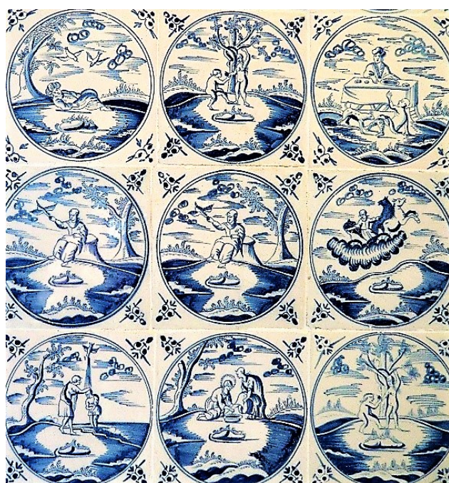
Abb. 24: Teilausschnitt der Fliesenwand.

reiche Mann und der arme Lazarus“ (N 110) zu sehen. In der mittleren Reihe sind links und in der Mitte „Elia und die Raben“ (O 216) gleich zweimal zu erkennen. Dieses Mal aber in einer anderen Bildgestaltung als das Bild in der oberen Reihe. Es folgt dann „Elias Himmelfahrt“ (O 228). In der unteren Reihe ist links die „Taufe Jesu“ (N 27), in der Mitte „Die Fußwaschung“ (N 167) und auf der rechten Seite „Der Sündenfall“ (O 7) zu sehen. Diese Reihenfolge lässt nur den Schluss zu, dass bei der Anordnung der Fliesen keine der zuvor erwogenen Möglichkeiten zutrifft. Beim Betrachten einer Reihe