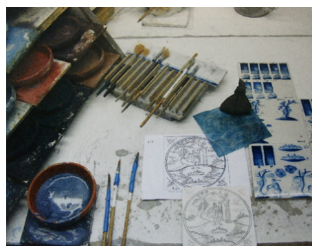
Abb. 4: Der Arbeitsplatz des Fliesenmalers.

Die Umrisszeichnung der Mutter-Sponse wurde archiviert, um später bei Bedarf damit weitere Sponsen herstellen zu können. Die untergelegten, durchstochenen Pauspapier-Blätter wurden für die Herstellung der Bibelfliesen verwendet. Auf diesen Sponsen (auch Durchstaubschablonen genannt) fanden nur die Hauptlinien des zentralen Bildteiles Berücksichtigung. Die weiteren Bildteile wie Berge, Bäume, Eckmotive, Wolken usw. wurden von den Fliesenmalern ohne Vorgabe frei gestaltet (s. Abb. 5- 6). Eine solche Sponse konnte 1.000 bis 2.000-mal verwendet werden. 14 Diese Art der Herstellung erklärt, warum die Hauptmotive der Bibelfliesen immer wieder in relativ gleicher Form vorzufinden sind. Die Bibelfliesenmaler arbeiteten dabei im Akkord. Ihr Lohn richtete sich nach der Zahl der bemalten Fliesen. So hat z. B. der Fliesenmaler Barend Wybes in der ersten Hälfte des 19. Jahrhunderts in fast 45 Jahren insgesamt 155.450 Bibelfliesen gemalt. 15