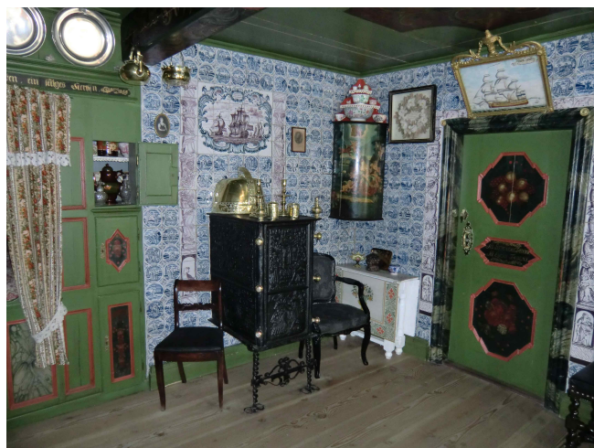
Abb. 25: Der „Königspesel“ des Kapitäns Tade Hans Bandidix.

(2) Der „Königspesel“ auf Hallig Hooge. Das Wort „Pesel“ ist die norddeutsche