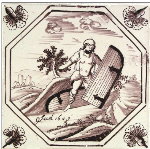
Abb. 28: „Simson und das Stadttor von Gaza“ (Ri 16,3); Makkum um 1790.

(3) Die Bibelfliesen dienen auch der Unterhaltung. Auf den Bibelfliesen gibt es auch Motive, die primär unterhalten wollen. Dazu gehören zum einen Darstellungen von Tieren 44 und zum anderen Motive wie „Potiphars Frau versucht Joseph zu verführen“ (Gen 39,11f.), „David und Batseba“ (2Sam 11,2ff.) und „Judith enthaup- tet Holofernes“ (Judith 13,7f.). Auch zu diesen Themen fand man künstlerische Vorlagen. In diesen Zusammenhang gehören auch die Geschichten von Simson: z. B. wie Simson das Stadttor von Gaza wegrägt (Abb. 28). Auch das Motiv „Jona wird an Land gespien“ (Abb. 29) lässt einen spielerischen Umgang mit dem Thema erkennen. Es wurde in 15 unterschiedlichen Versionen dargestellt.