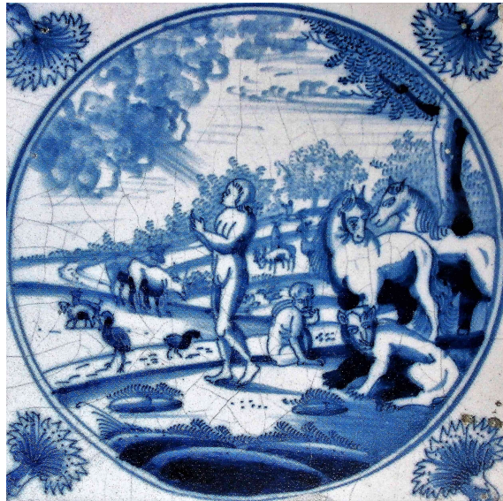
Abb. 16: Bibelfliese zu Gen 2,7 (Amsterdam, 2. Viertel 18. Jh.).

Am Beispiel „Der Erschaffung des Menschen“ (Gen 2,7) kann die Wirkungsgeschichte der Merianschen Bibelillustration exemplarisch aufgezeigt werden. Die Abbildung 14 zeigt den originalen Kupferstich von Merian.