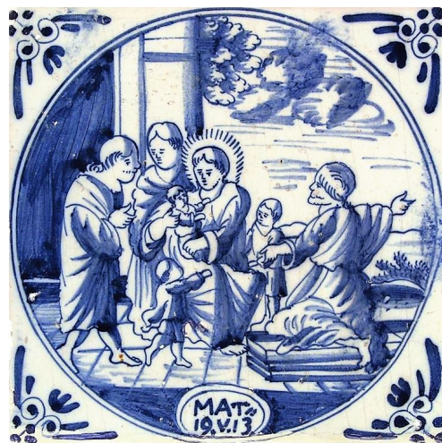
Abb. 27: „Jesus segnet die Kinder“ (Mt 19,13f.); Makkum um 1730.

Eine solche Elementarisierung kommt den menschlichen Sehgewohnheiten entgegen. Das Bild kann mit dem Auge rasch ganzheitlich erfasst werden. Dies könnte ein weiterer Grund dafür sein, dass Bibelfliesen heute wieder das Interesse bei Menschen finden.