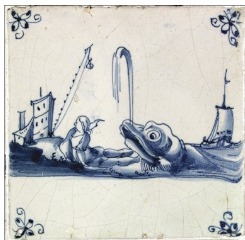
Abb. 29: „Jona wird an Land gespien“ (Jona 2,11); Rotterdam um 1680.

Das Bemühen, schwierige Sachverhalte anschaulich und nachvollziehbar darzustellen, ist manchmal amüsant anzusehen. Bei der Flucht aus Sodom und Gomorrha wird gerade der Augenblick im Bild festgehalten, in dem Lots Frau zur Salzsäule erstarrt. Ihre untere Hälfte ist als steinerne Säule zu erkennen und in der oberen Hälfte sind noch die fraulichen Konturen erkennbar (Abb. 30).