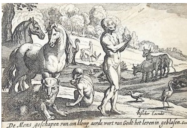
Abb. 15: P. Schut in N. Visscher, Historiae Sacrae (um 1650).

Bei dem Amsterdamer Buchhändler Nicolaes Visscher erschien ziemlich bald unter dem Titel „Historiae Sacrae Veteris et Novi Testamenti. Biblische figuren, Darinnen die fürnembste historien, in heiliger Schrift begriffen, geschichtmässig entworfen“, Amsterdam um 1650,