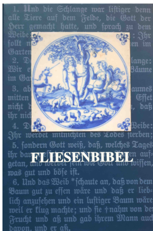
Abb. 32: Titelseite (2012).

Die Bibelfliesen haben seit einiger Zeit neue Aufmerksamkeit auf sich gezogen.