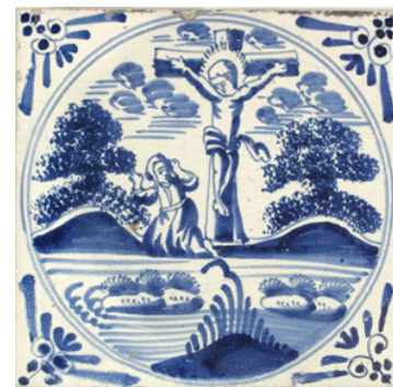
Abb. 12: Geschwämmelte Ausführung (N 196).

Eine Besonderheit bilden die „Basterde Histories“, d. h. einfach gemalte Bibelfliesen, deren Kennzeichen die geschwämmelten Bäume sind (Abb. 12). Sie werden auch „Kleine Histories“ genannt. Diese waren die billigsten Bibelfliesen. Sie sind von ca. 1700 bis ungefähr 1900 in großen Mengen produziert worden. Die Darstellung ist auf das Notwendigste reduziert und stark vereinfacht. Teilweise ist es sogar schwierig herauszufinden, welche biblische Geschichte gemeint ist. Der Hintergrund zeigt ein festes Schema von zwei Hügeln mit darauf stehenden Bäumen. Diese sind nicht mit dem Pinsel gemalt, sondern mit einem Schwamm aufgetragen worden. Daher kommt der Begriff der geschwämmelten Bäume. 18