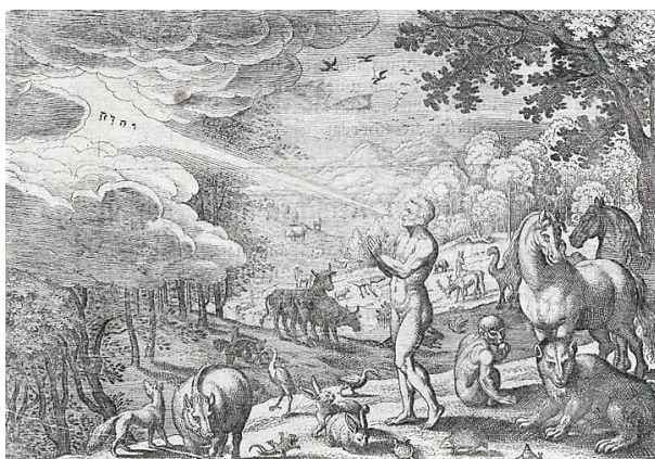
Abb. 14: Kupferstich von Merian, Icones Biblicae, 1625.

Im Jahre 1630 erschien dann in Straßburg die gesamte „Merianbibel“. Cornelius Danckert brachte die früheste Kopie der 233 Stiche von Merian in seitenverkehrter