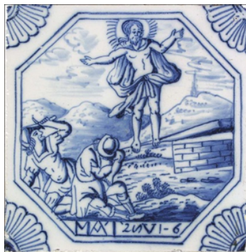
Abb. 21: „Die Auferstehung“ (Mt 28,2–4), Rotterdam 1740.