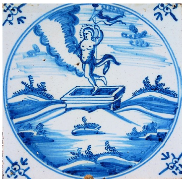
Abb. 20: „Die Auferstehung“ (Mt 28,2–4), Amsterdam 1750.

Im Blick auf die Häufigkeit des Vorkommens von Fliesen zu einzelnen Themen sind im Neuen Testament die „Auferstehung“ (Mt 28,2–4) und die „Versuchung Jesu in der Wüste“ (Mt 4,1ff.) deutlich die „Renner“. Es folgen die Themen „Jesus und die Samariterin“ (Joh 4,1ff.), „Heilung des Dieners des römischen Hauptmanns“ (Mt 8,5ff.), „Taufe Jesu“ (Mk 1,9–11), „Enthauptung Johannes des Täufers“ (Mt 14,1ff.) und die Kindheitsgeschichten Jesu: „Verkündigung der Geburt an Maria“ (Lk 1,28ff.), „Verkündigung an die Hirten“ (Lk 2,8–11), „Flucht nach Ägypten“ (Mt 2,14) und „Der zwölfjährige Jesus im Tempel“ (Lk 2,46).