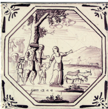
Abb. 10: Fliese mit achteckigem Rahmen (O 24).

einem kleinen eigenen Feld, das oval (s. Abb. 7), trapezförmig oder rechteckig (s. Abb. 11) gerahmt ist. Die Ausführung einer Bibelfliese mit einem Bibeltext war erheblich teurer als die normale Ausführung. Mehrfarbige Ausführungen des biblischen Themas sind selten zu finden (Abb. 11).