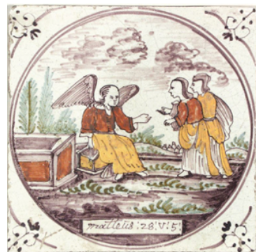
Abb. 22: „Engel und die Frauen“ (Mt 28,5–6), Utrecht 1780.