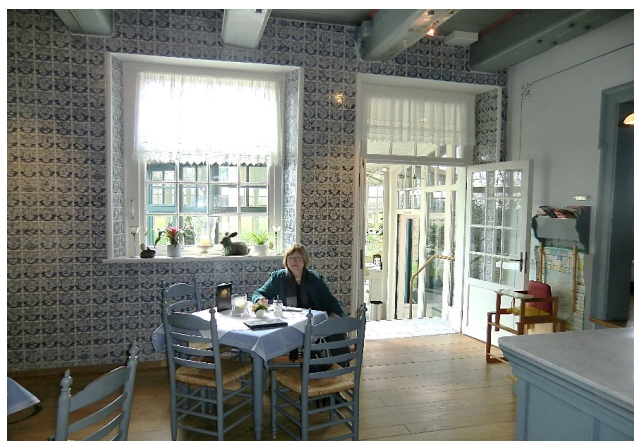
Abb. 23: Gesamtansicht der Fliesenwand im Gastraum des Sielhofs.

Das Anbringen der Bibelfliesen im Sielhof zeigt, dass in Friesland, so wie in den Niederlanden, Fliesen in den „guten Stuben“ und in, oder an Kaminen ihren Platz gefunden haben. Beim Betrachten dieser Fliesenwand stellen sich Fragen wie z. B.: Sind die Fliesen nach einem erkennbaren Prinzip angeordnet worden? Gibt es eine Trennung nach Altem und Neuem Testament? Ist eine Zuordnung nach der biblischen Reihenfolge vorgenommen worden? Gibt es Zusammenstellungen nach Themen (z. B. Propheten, Wunder, Gleichnisse)? Um Antwort auf diese Fragen zu finden, soll ein beliebiger Ausschnitt von neun Fliesen herausgegriffen werden. In der oberen Reihe ist links „Elia und die Raben“ (O 216), in der Mitte „Der Sündenfall“ (O 7) und rechts „Der