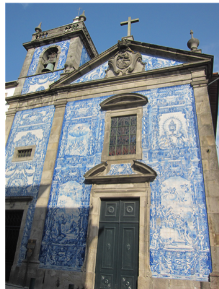
Abb. 2: Capela das Almas, Porto.

Spanien und Portugal haben ebenfalls große Schätze an kobaltblauen Fliesen aufzuweisen. Dort schmückte man damit aber die Häuserfassaden und die Außen- und teilweise auch Innenwände der Kirchen. Das Anbringen der Fliesen an den Außenwänden der Häuser war in der Kolonie Brasilien entstanden. Dadurch sollten die Häuser gegen den Regen geschützt werden. Von dort kam diese Verwendungsart zurück ins Mutterland. Auf den Fliesen in Por-