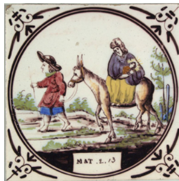
Abb. 11: Mehrfarbige Bildgestaltung (N 21).