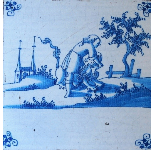
Abb. 6: Bibelfliese zu Ri 14,6: Simson zerreit einen Lwen (aus Rotterdam).

Hauptlinien des zu malenden Bildes als kleine schwarze Punkte auf der Zinn- glasur. Mit einem speziellen Pinsel aus Rinderohrhaaren (Abb. 3, Nr. 8) werden anschlieend zunchst die Hauptlinien des Bildes (Nr. 9) und dann das gesamte Bild gemalt (Nr. 10). Nach dem zweiten Brand, dem Glasurbrand, ist die Fliese fertig (Nr. 11). Auf der Fliese sind keine Spuren von Staub zu erkennen, da der Kohlenstaub verbrennt, ohne Rckstnde zu hinterlassen.