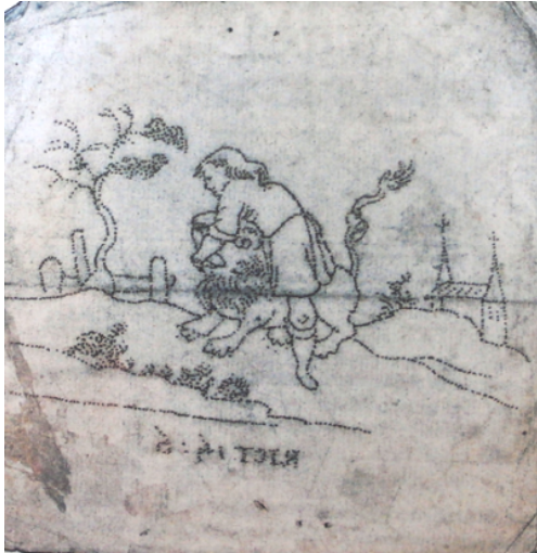
Abb. 5: Sponse: Die Abbildung zeigt die Rückseite; daher ist das Bild spiegelbildlich.