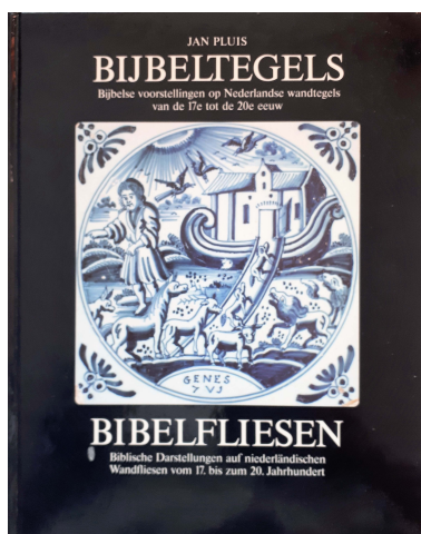
Abb. 1: : Titelblatt von J. Pluis, Bijbeltegels / Bibelfliesen (1994).

auf die Bibelfliesen als Kulturgut und als Ausdruck einer tiefen religiösen Frömmigkeit wieder aufmerksam wurde. 7