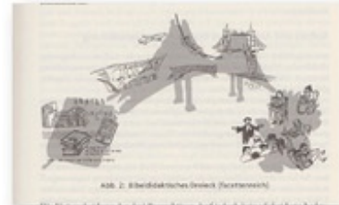
Abb. 2 Zimmermann/Zimmermann, 2013, 9.

Bibeldidaktik eine Brücke, die die → Bibel in ihrer Welt und den Menschen in seiner Welt miteinander verbindet. Zwischen beiden wird ein Graben angenommen – der Zeit, des Raums, der Weltanschauung. Das zweite Bild (Abb. 2) ist komplexer: Es fragt nach der Gestalt der Bibel (Bibelerzählungen, die Bibel als Gesamterzählung, Bibelversionen, die Bibel als Heiliges Buch), nach der Situation der Rezipientinnen und Rezipienten (Erfahrungen, Erwartungen, Bedürfnissen), nach der Konstruktion der Brücke (informelles oder formales Lernen, Intentionen, Methoden) (Zimmermann/Zimmermann, 2013, 7-10). Im Folgenden soll, ausgehend von den Fragen, die das bibeldidaktische Dreieck aufruft, erläutert werden, was unter diskursiver Bibeldidaktik verstanden werden kann.