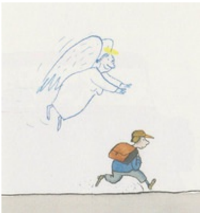
Abb. 3 Bauer, 2003.

Das Bilderbuch „Opas Engel“ von Jutta Bauer (2001/2003) erzählt eine doppelte Geschichte: Die Erzählfigur, ein alter Mann, der dem Tod entgegenggeht, erzählt seinem Enkel sein Leben unter der Deutungsperspektive: „Ich hatte Glück“. Mit ihren Illustrationen erzählt die Autorin eine andere Geschichte: „Ein Engel hat ihn begleitet“. Besser lässt sich kaum zeigen, wie die Bibel in ihrer großen Geschichte von Gott (und ihren vielen kleinen) erzählt: Da ist die Geschichte der Menschen, des Volkes Israel, der Juden und Christen; und da ist die Meta-Geschichte Gottes mit der Welt, dem Menschen, dem Volk und Jesus Christus. In der