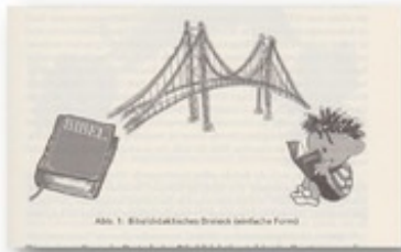
Abb. 1 Zimmermann/Zimmermann, 2013, 7.