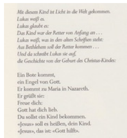
Abb. 5 Steinwede, 1982, 100.