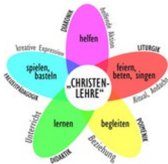
Abb. 2 Praxisvollzüge von Christenlehre heute

Die zu verzeichnende Vielgestaltigkeit der Praxis von Christenlehre legt es aber auch nahe, die konkret vorfindlichen kindlichen Tätigkeiten, d.h. ihre Beteiligungsmöglichkeiten, zum Ausgangspunkt zu nehmen.