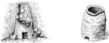
Abb. 1 Ein Backofen (Tannur) stand auf einer Feuergrube. Beim Brotbacken wurde der feuchte Teig an die Innenwände geklatscht und blieb an ihnen kleben, bis er durchgebacken war.

Dieser Text aus → Deuterocesaja gibt Einblick in alltägliche Verwendungsweisen des Feuers: Es dient dem Wärmen, als Lichtquelle, zum Backen und Braten. Im Kontext geht es um Kunsthandwerker, die ihr Handwerk zur Herstellung von Götterbildern missbrauchen.