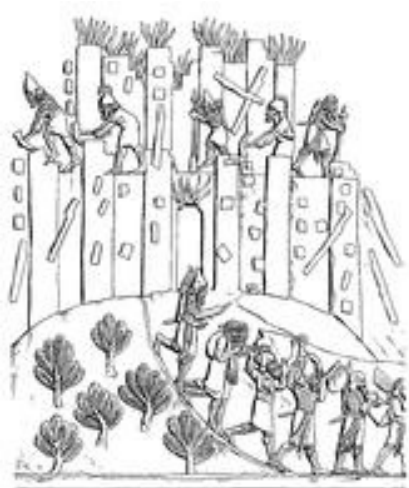
Abb. 3 Assyrische Soldaten schleppen Beute aus einer eroberten Stadt, zerstören die Stadtmauer und legen Feuer an die Häuser (Relief aus dem Palast Assurbanipals, 669-630 v. Chr., in Ninive).

Im Haushalt führten Feuerstellen leicht zu Verletzungen und auch zu Bränden. Ex 22,5 gibt einen Hinweis darauf, dass man versucht, den fahrlässigen Umgang mit Feuer dadurch zu begrenzen, dass der Verursacher Schadenersatz zu leisten hat. Seine destruktive Wirkung entfaltet das Feuer v.a. im Krieg, wenn Häuser ( Ri 12,1 ; 2Kön 25,9 ) oder ganze Städte ( Num 31,10 ) abgebrannt werden. Simson setzt es im Kampf gegen die → Philister ein ( Ri 15 ). Brandpfeile dienen im Krieg als Waffen ( Ies 50,11 ). Feuer als Naturkatastrophe wird auf Gott als Verursacher zurückgeführt ( Gen 19,24 ).