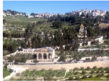
Abb. 3 Gethsemane-Kirche / „Kirche der Nationen“.

Kirche“ ( ecclesia elegans ) gewesen; von da aus habe der Weg weiter den Berg hinunter „nach Gessamani“ geführt, wo die Schar unter lautem Klagen der Gefangennahme Jesu gedachte. Demnach bestimmte man am Ende des 4. Jh.s Gethsemane auf doppelte Weise: a. als jenen Ort, wo sich Jesus mit seinen Schülern aufzuhalten pflegte, im unteren Bereich des Abhanges, und b. den mit einer Kirche markierten Ort seines Gebetes weiter bergauf. Die „herrliche Kirche“ der Egeria (also die eigentliche Gethsemane-Kirche, die an Jesu Gebetskampf und den Schlaf seiner drei engsten Vertrauten erinnert) befand sich an dem Ort, an dem heute die (1919-1924 errichtete) „Kirche der Nationen“ steht; hier wurden 1920 bei Grabungen die Reste zweier Vorgängerbauten entdeckt. Zentraler Punkt dieser Kirche war ein heiliger Felsen, den man als Ort der Agonie Jesu verehrte. Der Kirche gegenüber, ca. 100 m in nördlicher Richtung, befindet sich die „Verratsgrotte“. Zwischen der Gethsemane-Kirche und der Verratsgrotte liegt ein Garten, der mit seinen alten, knorrigen Olivenbäumen dem ganzen Gelände sein besonderes Flair gibt. Die Gethsemane-Kirche / ecclesia elegans / „Kirche der Nationen“ ist als Ort der Agonie Jesu im Laufe ihrer langen Geschichte immer wieder einmal in Frage gestellt worden. Unangefochten hingegen haftete der Name Gethsemane vor allem an der Grotte als dem Ort des Aufenthaltes Jesu und des Verrates des Judas sowie an dem angrenzenden „Garten Gethsemane“.