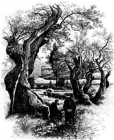
Abb. 4 Garten Gethsemane mit Ölbäumen.

Die Evangelisten skizzieren auf der Erzählebene eine konkrete Örtlichkeit, an der sie den Beginn der Passionsereignisse platzieren. Wie viel sich dabei eigener Anschauung und wie viel sich überlieferter, bereits narrativ überformter Information verdankt, bleibt offen. Heute lässt sich diese topographische Situation nur noch bedingt nachvollziehen. Die Bebauung des Geländes hat eine Eigendynamik gewonnen und – ähnlich wie die Via Dolorosa den Weg – hier nun den Raum nach liturgischen und spirituellen Bedürfnissen neu gestaltet.