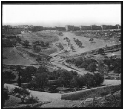
Abb. 1 Gelände im Umfeld von Gethsemane, Mitte 19. Jh.

Überhaupt erweist sich der Ölberg während der letzten Phase der Jesusgeschichte als ein bedeutungsvoller Ort. Vom Ölberg aus beginnt der Einzug nach → Jerusalem ( Mk 11,1 / Mt 21,1 / Lk 19,29 ), wobei sich auch manche alttestamentliche Erinnerungen einstellen ( 2Sam 15,30 – Davids Flucht; Sach 14,4 – das Kommen Gottes). Irgendwo auf dem Ölberg – mit Blick auf den gegenüber liegenden → Tempel – ist die Endzeitrede Jesu platziert ( Mk 13,3 / Mt 24,3 ). Hierher kommen Jesus und seine Schüler nach ihrem letzten Mahl ( Mk 14,26 / Mt 26,30 / Lk 22,39 ). Auf dem Ölberg findet schließlich auch die „→ Himmelfahrt “ als wirkungsvolle Abschiedsszene statt ( Apg 1,12 ; Lk 24,50 – in Richtung Betanien).