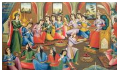
Abb. 6 Josefs Schönheit (Islamische Malerei; 19. Jh.).

Auch in der dritten der drei großen monotheistischen Buchreligionen, im Islam, kam es zu einer intensiven Auseinandersetzung mit der Gestalt Josefs. Ihm wurde die 12. Sure im Koran gewidmet ( Text Koran ). Von dieser Sure gingen vielfältige Wirkungen auf die Geschichte der orientalischen Literatur aus. Sie erzählt wie