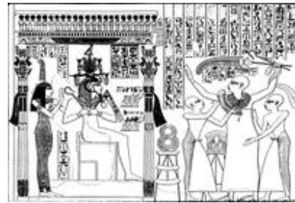
Abb. 3 Paser, Bürgermeister von Theben, wird in Anwesenheit von Ramses II. von zwei Dienern eingekleidet und mit dem Ehrengold des Königs ausgezeichnet (13. Jh. v. Chr.).

Den I. Hauptteil bilden die Kap. Gen 39,1-41,57 . In ihnen ist Josef in der Fremde ganz auf sich allein gestellt. Man erfährt nichts über seine Familie. In drei Anläufen wird die Geschichte eines Hebräers in Ägypten erzählt, der vom Sklaven zum Hausverweser Potifars ( Gen 39,1-19 ), vom Häftling zum Gefangenenaufseher ( Gen 39,20-40,23 ) und schließlich vom Traumdeuter zum Vizepharao und Landwirtschaftsminister aufsteigt ( Gen 41,1-57 ).