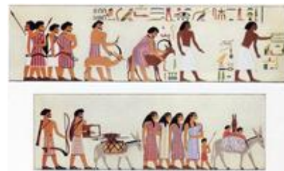
Abb. 1 Semitische Kleinviehnomaden in Ägypten (Grabmalerei aus Beni Hassan; 19. Jh. v. Chr.).

Die Erzeltern Erzählungen bilden allerdings nicht nur einen genealogischen und familiengeschichtlichen Rahmen für die Josefsgeschichte, sondern kennen auch die mit dem Hungersnotmotiv (→ Hunger ; → Hungersnotstele ) verknüpfte Problematik der vorübergehenden Übersiedlung von Protoisraeliten (→ Israel ) nach Ägypten ( Gen 12,10-20 ; Gen 26,1f ; Gen 42,1ff ).