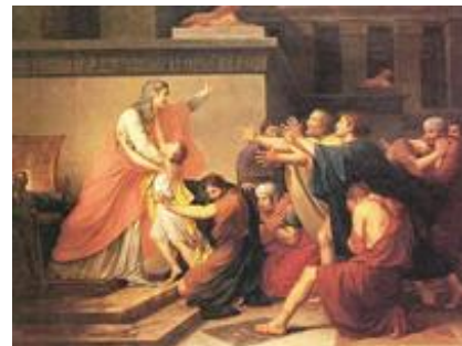
Abb. 5 Josef gibt sich seinen Brüdern zu erkennen (Francois-Pascal Gerard, 19. Jh.).