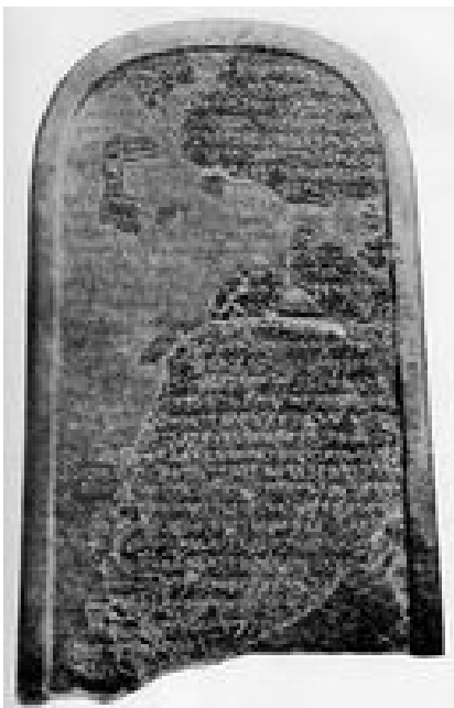
Abb. 1 Mescha-Stele.

Als wichtigste Quelle über den moabitischen Kemosch ist die Inschrift auf der Mescha-Stele aus dem 9. Jh. v. Chr. zu nennen (→ Mescha / Mescha-Stele mit dem Text der Inschrift). Kemosch wird dort 12-mal erwähnt, inklusive der Nennung innerhalb des Personennamens Kemoschjat und des zusammengesetzten Götternamens Aštarkemosch. Die Inschrift ist formal ein Baubericht des Königs Mescha. Eigentlicher Zweck der Inschrift ist aber die Selbstrepräsentation des Königs. So rühmt sich Mescha in der Inschrift vor allem seiner militärischen Erfolge. Mit König Meschas Baumaßnahmen und seinen errungenen Gebietserweiterungen dürfte Moabs Staatlichkeit begonnen haben. In der Inschrift wird die Stellung Kemoschs deutlich: Kemosch