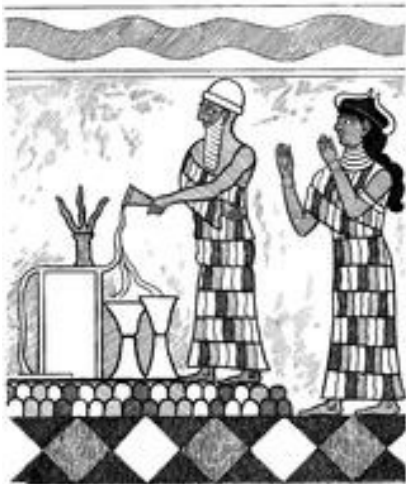
Abb. 3 Ein König spendet einer Gottheit Flüssigkeit als Opfergabe in einen Opferständer; dahinter fungiert eine (niedere) Göttin als Mittlerin (Wandmalerei aus Mari; 2. Jt. v. Chr.).

größerer, kultischer Professionalisierung (z.B. an Heiligtümern) Autorität und Einfluss leichter zu gewinnen waren und Kultordnungen sich deshalb auch allgemein verbindlich durchsetzen ließen. Die „Kultzentralisation“ und andere Kultverbote (vgl. Lev 19,26 ) sind hierfür ein Beispiel.