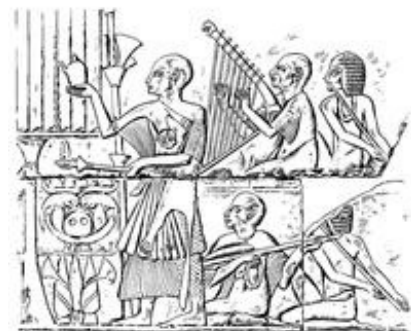
Abb. 2 Ägyptischer Priester nähert sich einer Gottheit mit einer Libationsvase, aus der er Flüssigkeit zu Boden gießt, und einem Räucherarm, auf dem er Weihrauch verbrennt; dahinter spielen vier Musiker auf Instrumenten.

So wird → Samuel als Richter, Prophet und Priester dargestellt ( 1Sam 1-3 ; 1Sam 7,15 ), → Leviten erscheinen als Priester, die auch Recht sprechen