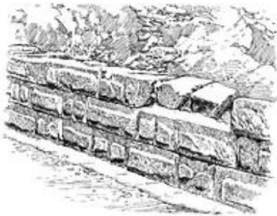
Abb. 5 Eine Mauer des Palastes von Samaria. Steinquader mit Spiegelschlag sind als Läufer und Binder gesetzt (Eisenzeit II).

das Mauerwerk wurden teilweise zugehauene Steinquader mit Spiegelschlag in der Tradition der zeitgenössischen nordsyrisch-phönikischen Stadtkultur verwendet. Außerdem wurden Reste von Volutenkapitellen, d.h. Kapitellen in der Form von stilisierten Palmen, gefunden. Die Ausgrabenden unterscheiden verschiedene Bauphasen. Zu Phase I soll eine innere Umfassungsmauer und ein als „Palast“ gedeutetes Gebäude im Südwesten des Podiums gehören. Diese Bauphase wird der Zeit Omris zugeschrieben. Der weitere Ausbau des Podiums mit einer äußeren Kasemattenmauer (Phase II) wird in die Zeit → Ahabs datiert. Spätere Hinzufügungen sollen aus der Zeit → Jehus (Phase III, ausgehendes 9. Jh. v. Chr.) und → Jerobeams II. (Phase IV, 8. Jh. v. Chr.) stammen. Die Datierungen der Ausgrabenden orientieren sich weitgehend am biblischen Text, da die Keramik des 9. und 8. Jh.s v. Chr. nur vereinzelt bestimmten architektonischen Einheiten zuzuordnen ist. Dennoch wurden die chronologischen Zuweisungen nahezu einmütig in der Fachliteratur übernommen. Darüber hinaus fanden sich Reste einer vorurbanen Siedlungsphase (Phase 0) in Form von Zisternen und Wein- bzw. Ölpresen sowohl im Bereich des Podiums als auch über den gesamten Siedlungshügel verstreut. Aufgrund der ältesten Keramik in den Fundamentgräben des Podiums wird Phase 0 in das 10. Jh. v. Chr. datiert.