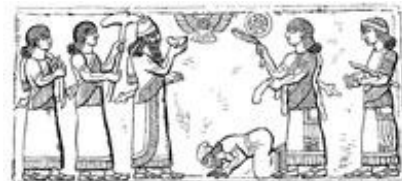
Abb. 2 König Jehu von Israel unterwirft sich dem assyrischen

Auch in neuassyrischen Königsinschriften des 9. und 8. Jh.s v. Chr. wird der Name Omri genannt. Auf dem vom assyrischen König Salmanasser III. im Jahr 841 v. Chr. in Nimrud aufgestellten sog. Schwarzen Obelisken wird Jehu als „Sohn Omris“ mār ḫumrî bezeichnet (TUAT 1, 363;