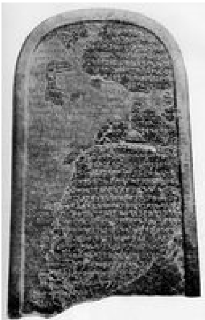
Abb. 1 Mescha-Steile.

Omri ist mehrfach in außerbiblischen Texten erwähnt, davon zwei Mal in der Inschrift auf der Stele des Königs → Mescha von → Moab aus dem letzten Drittel des 9. Jh.s v. Chr. (TUAT 1, 646-650; Gaß, 5-65; HTAT, 242-248). Der Text sagt, „Omri, der König von Israel unterdrückte“ Moab „viele Tage“ (Zeile 4f). Die Inschrift führt weiter aus, Omri habe das Land mhdb' (alttestamentlich Medeba) eingenommen (Zeile 7f) und dieses „zu seiner Zeit und der Hälfte der Zeit seines Sohnes / seiner Söhne, vierzig Jahre“ bewohnt (Zeile 8, Übersetzung nach HTAT, 245). Erst zur Zeit Meschas sei die Besetzung von Teilen Moabs durch die Omriden beendet worden.