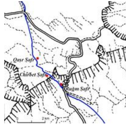
Abb. 3 Übersicht über die Skorpionensteige.

(Koordinaten: 162.035; N 30° 54' 20" , E 35° 07' 26" ) gleichgesetzt (kritisch hierzu Aharoni 33; Rainey / Notley 35). Auf Naqb eṣ-Ṣafā wimmelt es zudem von Skorpionen, so dass die Bezeichnung Skorpionensteige durchaus gerechtfertigt ist.