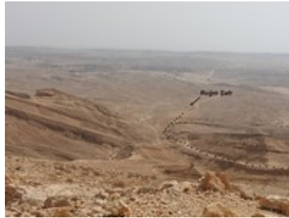
Abb. 8 Der untere Abschnitt der Skorpionensteige

dann Stufen nötig geworden sind. Wo dieser Weg eine Steigung von 20 %