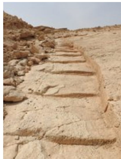
Abb. 9 Stufen des Wegs der Skorpionensteige.