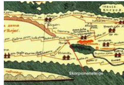
Abb. 2 Skorpionensteige auf der Tabula Peutingeriana .

Darüber hinaus könnte die Skorpionensteige noch in der Tabula Peutingeriana eingezeichnet sein (Jericke 62), einer Karte des römischen Straßensystems, die ihre Wurzeln in römischer Zeit hat. In römisch-byzantinischer Zeit war der Aufstieg von Naqb eš-Šafā die bedeutendste Straße von Judäa nach Elat (Aharoni 36-37).