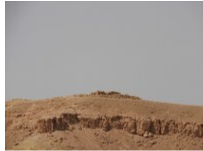
Abb. 6 Chirbet Šafr .

und mit 9 x 9 m ähnlich groß wie Structure A auf Ruġm Šafr . Chirbet Šafr ist ebenfalls aus Quadersteinen errichtet und hatte vermutlich zwei Stockwerke, worauf eine Treppe und Pfeiler hinweisen. Der Eingang zu diesem Fort befand sich im Norden. Der archäologische Befund weist in das 2.-4. Jh. n. Chr. Um dieses Gebäude war ein 20 x 20 m großer Hof für Viehhaltung angelegt. In diesem Hof standen zwei 1 m hohe Steine mit vielleicht kultischer Nutzung als Masseben. Im Westen dieses Hofes befindet sich ein 1,5 m breites Tor, das zur Passstraße führt. 300 m südlich von Chirbet Šafr entdeckte man die 5 m hohen Überreste eines Damms.