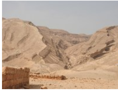
Abb. 4 Die Skorpionensteige führt südlich (links) des Nahal Gov zum Negev-Hochland (Blick nach Westen mit Ruġm Ṣafr im Vordergrund).

Gerne wird der Anstieg Akrabbim mit Naqb eṣ-Ṣafā bzw. Naqb Ṣafr