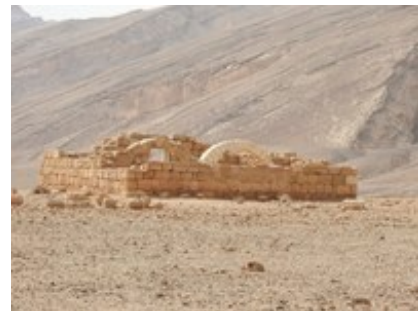
Abb. 5 Ruġm Ṣafr .

3.1. Ruġm Ṣafr (Koordinaten: 1622.0349; N 30° 53' 47" , E 35° 07' 40" ). Die unterste Festung Ruġm Ṣafr überwacht den Einstieg in den Steilhang. Ruġm Ṣafr besteht aus zwei Ruinen. Structure A ist ein ungefähr 9 x 9 m großes, aus Quadersteinen gebautes Fort, dessen Mauern etwa 0,8 m dick sind und bis zu einer Höhe von 1,8 m noch erhalten sind. Der Eingang befand sich in der Südwand. Links davon führte eine Treppe auf das Obergeschoss. In diesem Gebäude fand man vor allem Münzen aus dem 4. Jh. n. Chr. Westlich dieses Forts stand ein weiterer 11,5 x 7,5 m großer Gebäudekomplex (Structure B), der fünf Räume und einen Vorraum aufweist. Östlich davon war ein offener 11,5 x 3 m großer Hof vorgelagert. Der archäologische Befund dieser Gebäudeeinheit weist ebenfalls in das 4. Jh. n. Chr.