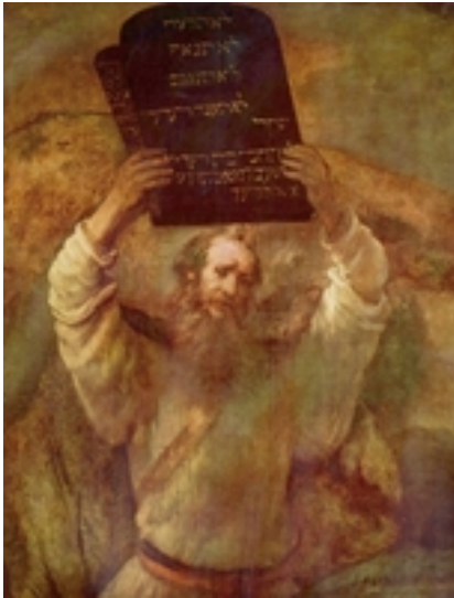
Abb. 7 Mose zerstört die Tafeln des Gesetzes (Rembrandt; 1659).

Stein als Kopfkissen ( Gen 28,11 ), den er dann angesichts der Gegenwart Gottes an diesem Ort aufstellt und salbt (→ Bethel ). In der deuteronomistischen Tradition (→ Deuteronomismus ) des Alten Testaments werden Mazzeben heftig bekämpft, weil man sie als Zeugnis für den Abfall von Jhwh betrachtet. Die prophetische Polemik gegen den Götzendienst wendet sich häufig ironisch gegen die Anbetung von Stein und Holz ( Jer 2,27 ; Jer 3,9 ; Ez 20,32 ; Dan 5,4,23 ; Jes 37,19 ).