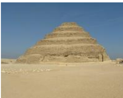
Abb. 1 Die Stufenpyramide des Djoser ist der älteste Monumentalbau aus Quadersteinen (Sakkara, Ägypten; um 2600 v. Chr.).

In der Kultur- und Religionsgeschichte Palästinas spielen die Steine wegen der geologischen Beschaffenheit des Landes eine bedeutsame Rolle. Basalt und Kalkstein standen in ausreichenden Mengen zur Verfügung und wurden je nach den lokalen und geographischen Gegebenheiten genutzt. Vor allem in der Baukunst sind die Steine von grundlegender Bedeutung. In Assyrien, Babylonien sowie in Ägypten wurden Tempel oder Paläste häufig aus behauenen Steinen gebaut ( 1Kön 5,31 ). Von besonderer Bedeutung war der Eck- oder Grundstein (hebr. ראש פנה roš pinnāh ). Er musste unerschütterlich und genau gelegt sein,