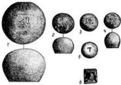
Abb. 3 Mit Maßeinheiten beschriftete Gewichtssteine legte man auf die eine Seite einer Tellerwaage.

Die frühesten palästinischen Steingefäße wurden aus Basalt hergestellt. Erst um 1200 v. Chr. wurden in Palästina Gefäße aus Kalkstein üblich. Alabastergefäße dienten als Behälter für Salben, Öle und Parfüms. Schon seit der Steinzeit wurden auch Geräte (z.B. Werkzeuge, Messer, Mühlen und Waffen) aus Stein hergestellt. Nach Ex 4,25 und Jos 5,2f. wurde zur Beschneidung ein scharfer Stein verwendet. Steine wurden zudem benutzt, um Feuer zu entfachen ( 2Makk 10,3 ).