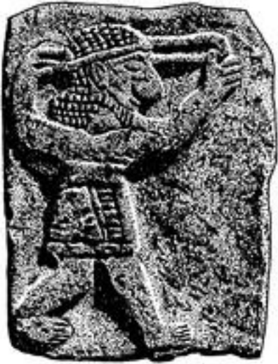
Abb. 5 Krieger mit Steinschleuder (Tell Ḥalāf in Nordsyrien; 9. Jh. v. Chr.).

Wurfgeschosse eingesetzt, ob mit oder ohne Schleuder ( 1Sam 17,40 ; 2Sam 16,6 ). Hagelkörner werden als „Steine“ bezeichnet, die Jhwh selbst schleudert ( Jes 30,39 ) oder die zumindest seinem Befehl unterstehen ( Ez 38,22 ).