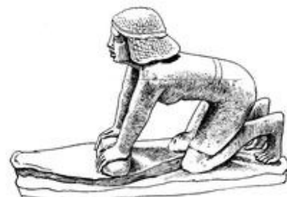
Abb. 4 Mit einem Reibstein aus rauem Basalt wurde täglich Getreide gemahlen.