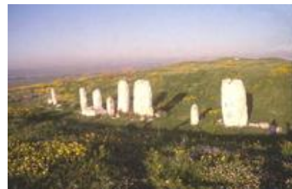
Abb. 6 Mazzeben im Freilichtheiligtum von Geser (Mittelbronzezeit II B; ca. 16. Jh. v. Chr.).

Seit der Steinzeit spielten Steine eine zentrale Rolle im religiösen Bereich und hatten vielfältige kultische Funktionen. Steine konnten als Symbole, Malzeichen oder Zeugen verwendet werden. Größere Steine konnten als Gedenksteine bzw. als Erinnerung an ein Ereignis oder als Zeugnis eines Eides dienen ( Gen 28,18 ; Gen 31,45 ; Jos 7,26 ; Jos 15,6 ; 1Sam 6,14 ; 1Sam 7,12 ).