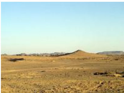
Abb. 3 Ansicht der Ruine von Tema.

Tema ist durch eine beträchtliche inschriftliche Überlieferung gekennzeichnet, die von aramäischen, keilschriftlichen, frühnordwestarabischen Textzeugen über die Erwähnung im Alten Testament bis hin zu arabischen Quellen reicht.