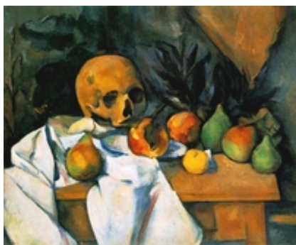
Abb. 3 Stillleben mit Schädel (Paul Cézanne; 1895-1900).

Mit Hiob teilt der → Prediger Salomo / Kohelet die Auffassung vom Tod als dem großen Gleichmacher ( Pred 2,15-16 ; Pred 3,19-20 ), verbunden mit der Vorstellung, dass alle Toten unterschiedslos in die Unterwelt eingehen. Doch die Grenze zwischen Leben und Tod wird bei ihm noch schärfer gezogen. Es gibt für den Menschen keinerlei Gewinn ( Pred 2,11 ; vgl. Pred 1,3 ; Pred 3,9 ), der über seinen Tod hinaus Bestand hätte. Denn nackt, wie er in die Welt kam, muss er wieder davon ( Pred 5,15 ). Sein Name wird vergessen und kein Andenken wird die Zeit überstehen. Selbst diese ideelle Form eines Weiterlebens in der Erinnerung der