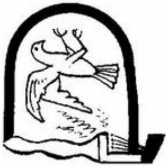
Abb. 1 Vogelfalle.

Zum Bereich der Natur gehören ferner die Bilder vom verdunstenden → Wasser ( Hi 14,11 ), vom sich auflösenden Nebel ( Weish 2,4 ), vom flüchtigen Schatten ( Ps 102,12 ; Ps 144,4 ; Hi 14,2 ) und vom → Staub , zu dem der Mensch zerfällt ( Ps 104,29 ). Aus dem Erfahrungsbereich des täglichen Lebens stammen wiederum die Bilder vom ausgegossenen Wasser ( 2Sam 14,14 ), vom zerbrochenen Gefäß ( Ps 31,13 ; Pred 12,6 ), von der erlöschenden Lampe ( Hi 18,6 ; Spr 20,20 ) oder vom Kleid, das von den → Motten zerfressen wird ( Jes 50,9 ; Ps 39,12 ; Hi 13,28 ).