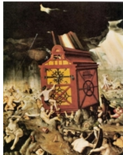
Abb. 2 Die Flut (Hans Baldung; 1516).

Wie auch in den Parallelüberlieferungen aus Mesopotamien markiert die Sintflut das Ende einer ersten Epoche des Menschengeschlechts und den Beginn einer zweiten, die zugleich neue Formen kosmischer und sozialer Ordnung mit sich bringt (Bosshard-Nepustil; → Sintflut / Sintfluterzählung ). Der Niedergang der „ersten“ Welt wird vor allem damit begründet, dass sich in ihr Gewalt in einem Ausmaß ausgebreitet hat, die den Schöpfungsauftrag „seid fruchtbar und mehrt euch“ völlig pervertiert. Wiederum in anthropologischer Zuspitzung ist es vor allem das menschliche Herz, in dem die Quelle dieser destruktiven Kraft gesehen wird, weil dessen „Dichten und Trachten“ nur Böses hervorbringt ( Gen 6,5 ; Gen 8,21 ). Das Neue an der nach-sintflutlichen Welt ist zum einen der → Bund Gottes mit der Schöpfung ( Gen 9,8-17 ), der ihr unverbrüchlichen Bestand gewährt. Dies wird unterstrichen durch die an Noahs Opfer anschließende Festlegung Gottes, wonach nicht vergehen sollen „Saat und Ernte, Frost und Hitze, Sommer und Winter, Tag und Nacht“ ( Gen 8,22 ). Neu ist allerdings auch, dass von nun an Gott selbst, nicht etwa nur der Mensch, für den Schutz und die Bewahrung des geschaffenen Lebens sorgen will ( Gen 9,4-6 ).