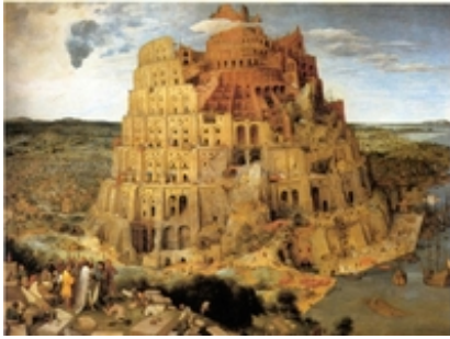
Abb. 3 Der Turmbau zu Babel (Peter Bruegel d. Ä.; 1563).

Mit der Verfluchung → Kanaans (Gen 9,19-27) weitet sich die Urgeschichte schließlich zur Völkergeschichte und legt damit die Grundlage für die Vätererzählungen. Vor allem die sog. „Völkertafel“ ( Gen 10 ) macht deutlich, dass die schöpfungsgemäße Welt aus einer Vielzahl verschiedener Völker, Ethnien und Sprachen besteht - im Gegensatz etwa zum Bild einer unter dem Dach einer Großmacht vereinten Welt.