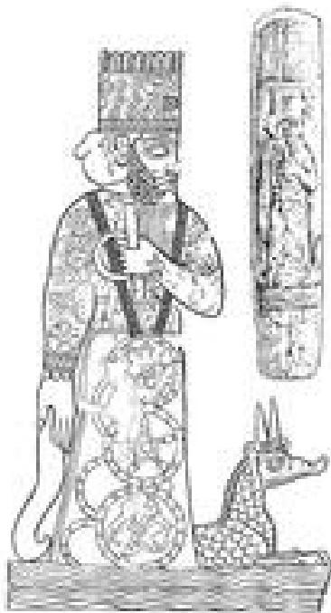
Abb. 3 Der Reichsgott Marduk steht auf einem gehörnten Mischwesen als Postamenttier (Rollsiegel; Babylon; 850-820 v. Chr.).

Nach dieser spätbabylonischen Überlieferung aus Sippar entwickelt sich die Schöpfung also aus dem Meer, in dem das Leben spendende Süßwasser als Rinnsal präexistent vorhanden ist. Die traditionelle Rolle des Schöpfergottes Ea / Enki nimmt in diesem Text sein Sohn → Marduk ein (siehe auch → Enuma Elisch ; vgl. Dietrich, 171f.; Bauks 1997, 255-258). Nach anderen Texten erschafft Ea / Enki die Welt aus dem Lehm des Apsu (z.B. „Kosmologie des ka/û -Priesters“ [Iraq-Museums Bagdad 11087/11]; vgl. TUAT III/4, 604). Oder das vom Apsu überspülte trockene Land wird zum fruchtbaren Sumpfland (Lugal-e VIII, 334-341). In der sumerischen Tradition begegnet Nammu als die Apsu zugehörige Göttin und Mutter des Ea / Enki. Ein spätbabylonischer Text wie der Dunnu- bzw. Charabmythos (Cuneiform Texts 46,43; vgl. TUAT III/4, 610f.) überliefert einen Sukzessionsmythos, in dem der göttliche Hirte Gaju seine Mutter, das Meer, tötet, um die Herrschaft zu erben. Schon der babylonische Welterschöpfungsepos Enuma Elisch handelte von der gewaltsamen Trennung des Süßwasserozeans Apsu vom Salzwasserozean Tiamat durch den Ea-Sohn Marduk. Erst nachdem die chaotischen Kräfte (→ Chaos ) dieser beiden Urgötter bezwungen sind, ist die Voraussetzung für weiteres Schöpfungshandeln gegeben.