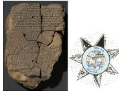
Abb. 4 Die sog. Babylonische Weltkarte und eine Rekonstruktion; die Welt liegt inmitten der Urwasser (Apsu); der Euphrat entspringt dem Gebirge oben und mündet im Sumpfland unten; ein Rechteck stellt Babylon, Kreise stellen weitere Ortschaften dar (Tontafel, Sippar, 6./5. Jh. v. Chr.).

Das genaue Verhältnis zwischen den Tiefen des Apsu, seinen Pforten und den dem irdischen Bereich zugehörigen Wassern ist nicht eindeutig (Horowitz, 344-347). So dient die Bezeichnung apsû z.B. im Schamasch Hymnus 35-38 für beide Bereiche (BWL 128, vgl. Horowitz, 340). Gilgamesch taucht in die Tiefen des Apsu, um die Pflanze der Verjüngung zu erlangen (Gilgamesch XI, 271-276). Apsu kann darüber hinaus sogar Anteil an der Unterwelt haben und zum Wohnort der Unterweltgötter, der Annunaki, werden (Erra 78,183-185) oder – wie in Ishtar und Dumuzi 137,179-182 – mit dem Unterweltfluss Chubur assoziiert werden (Horowitz, 342-344).