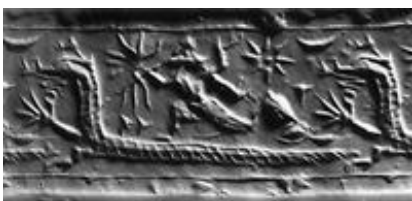
Abb. 5 Siegreicher Gott über dem

Breit belegt ist die Urmeervorstellung in der Literatur, die in Tontafelarchiven des Stadtstaates → Ugarit ( Rās Šamra [ Ras Schamra ]) aus dem 13. Jh. v. Chr. gefunden worden ist. Im Zentrum steht der Baal-Zyklus (→ Ba'lu ; vgl. → Baal ) des Ilmalku und als