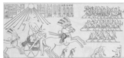
Abb. 3 Der königliche Kämpfer auf seinem Streitwagen.

Der königliche Kämpfer auf dem Streitwagen, der gegen die Feinde als Repräsentanten des Chaos vorgeht (→ Feinde, staatliche / Feindsymbolik ), ist in der ägyptischen Kunst häufig dargestellt. Spätestens seit der 18. Dynastie (ca. 1570-1345 v. Chr.) wird der König immer wieder in seinem Streitwagen gezeigt, so auf einem Relief → Amenophis IV. (ca. 1351-1334 v. Chr., Abb. 3). Der König ist deutlich größer als seine Truppen auf seinem herrlich geschmückten Kriegswagen bereit zum Kampf (Abb. 3).