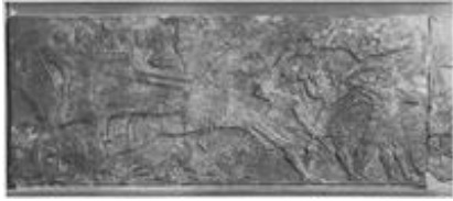
Abb. 4 Assurnasirpal II als Streitwagenkämpfer, Relief aus dem 9. Jh. v. Chr.

Wagenlenker (vgl. Abb. 4). Anders als in ägyptischen Darstellungen wird hier gezeigt, wie die Gegner der Assyrer heftigen Widerstand leisten, wobei auch sie letztlich gegenüber der Macht und Gewalt des Königs keine Chance haben.