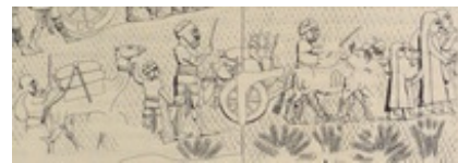
Abb. 1 Lastwagen: Lachisch-Relief.

Lastwagen für den Transport waren aus Holz. Sie hatten (zwei oder vier) hölzerne Scheibenräder mit dickeren Felgen, später auch Speichenräder. Allerdings waren sie im Altertum eher selten, da der Warentransport in der Regel mit Lasttieren wie dem → Esel oder dem → Kamel abgewickelt wurde. Das Relief,