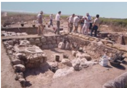
Abb. 5 Ölpresse in Ekron (8. Jh.).

In der gleichen Epoche belegt die im philistäischen Ekron (Tel Miqne; Koordinaten: 1358.1318; N 31° 46' 43", E 34° 51' 07" ) nahe d e r via maris nachweisbare (assyrische?) Großanlage zur „industriellen“ Olivenölproduktion mit einer geschätzten Kapazität von 1000 Tonnen jährlich, in der ein Großteil der Olivenernte des judäischen Berglandes verarbeitet wurde, dass unter den Bedingungen des assyrischen Imperiums der