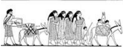
Abb. 3 Karawane von Semiten, die z.B. Augenschminke nach Ägypten bringt (ägyptische Grabmalerei; 19. Jh. v. Chr.).

vorderorientalischen Fernstraßen mit ihren Wegstationen und Karawansereien bildet auch die Grundlage des späteren und für die Zukunft bestimmenden römischen Straßensystems. Der Fernhandel zu Land ist besonders in assyrischen Quellen detailliert dokumentiert (Veenhof 1972, Faist 2001, Radner 2004).