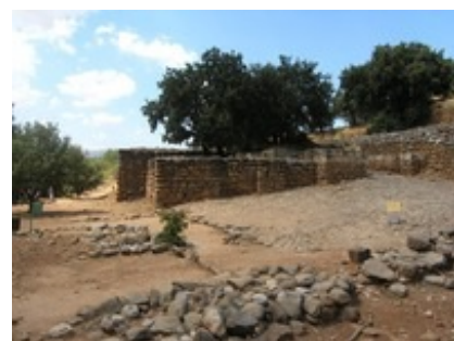
Abb. 4 Als Markt interpretierter gepflasterter Vorplatz vor dem Stadttor von Tel Dan.

Eventuell lässt sich der dem äußeren Stadttor vorgelagerte gepflasterte Platz von → Tel Dan als Marktplatz ansprechen. Da die meisten Gewichte und Gewichtssteine in Privathaushalten gefunden wurden (Kletter 1998), scheinen die Händler ihre Utensilien mit nach Hause genommen oder ihre Geschäfte auch im eigenen Wohnbereich abgewickelt zu haben. Die Gewichte zeigen regional unterschiedliche Normierungen (→