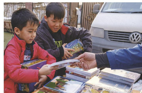
Nach einem Gottesdienst verteilen Mitarbeitende der Bibelgesellschaft Kinderbibeln und Bibeln für Erwachsene.

Bitte helfen Sie, damit 50000 biblische Schriften weitergegeben werden können.