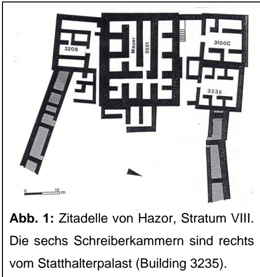
Abb. 1: Zitadelle von Hazor, Stratum VIII. Die sechs Schreiberkammern sind rechts vom Statthalterpalast (Building 3235).